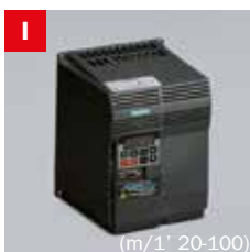
Inverter Frequency converter