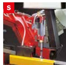
Skip elettrico Electrical skip