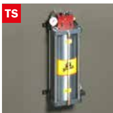
Dispositivo taglio a secco Dry cooling device